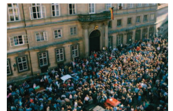
Abbildung 2 Genau zweihundert Jahre nach dem Sturm auf die Bastille wird die Deutsche Botschaft in Prag zu einem Geschichtszeichen der Gegenwart für Freiheit.

bedingungen ist heute deutlich weniger zu spüren als vor zwanzig Jahren. Spätestens der 11. September 2001 setzte ein neues dramatisches Zeichen, das in der Geschichte nach wie vor vieles möglich ist. Die sozialen, politischen, ökonomischen und ökologischen Probleme unserer Zeit geben genügend Anlass, an einem Ende der Geschichte zu zweifeln, welches geschichtsphilosophisch ohnehin nicht zu denken ist.