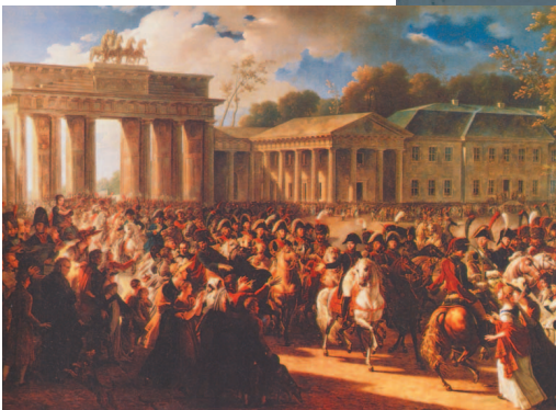
Abbildung 3 Das Brandenburger Tor, 1788–1791 im frühklassischen Stil erbaut, diente als Kulisse vieler geschichtsträchtiger Ereignisse, so auch beim Einzug des siegreichen Napoleon (1769–1821) in Berlin am 27.10.1806.

sion sollte einen Vorschlag für die organisatorische und inhaltliche Ausrichtung der weiteren Gedenkstättenarbeit erarbeiten. Es wurde dabei vorgeschlagen, drei »Aufarbeitungsschwerpunkte« zu bilden: 1. »Herrschaft – Gesell-