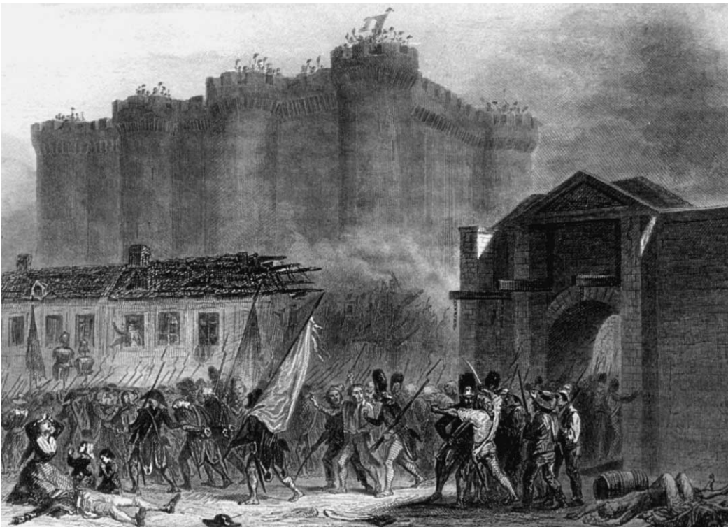
Abbildung 1 Der Sturm auf die Bastille im Jahre 1789 gilt als ein signifikantes Geschichtszeichen, weil er nicht nur als Symbol der Französischen Revolution gilt, sondern auch für den Drang des Menschen nach Freiheit und Gerechtigkeit angesehen werden kann.

entwurf arbeitete, entwickelte die Regierung Kohl einen Fahrplan für den Anschluss der DDR. Am Runden Tisch saßen sich Vertreter der »alten« und der »neuen Kräfte« mit je 19 Stimmen gegenüber. 8 Bei den Volkskammerwahlen am 18. März 1990 jedoch kommen die neuen Kräfte – ohne die SPD – auf insgesamt 8,6 Prozent der Stimmen; der Runde Tisch tritt nicht mehr zusammen. Die meisten Köpfe der Bürgerrechtsbewegung verschwinden, ähnlich ihrem Idol