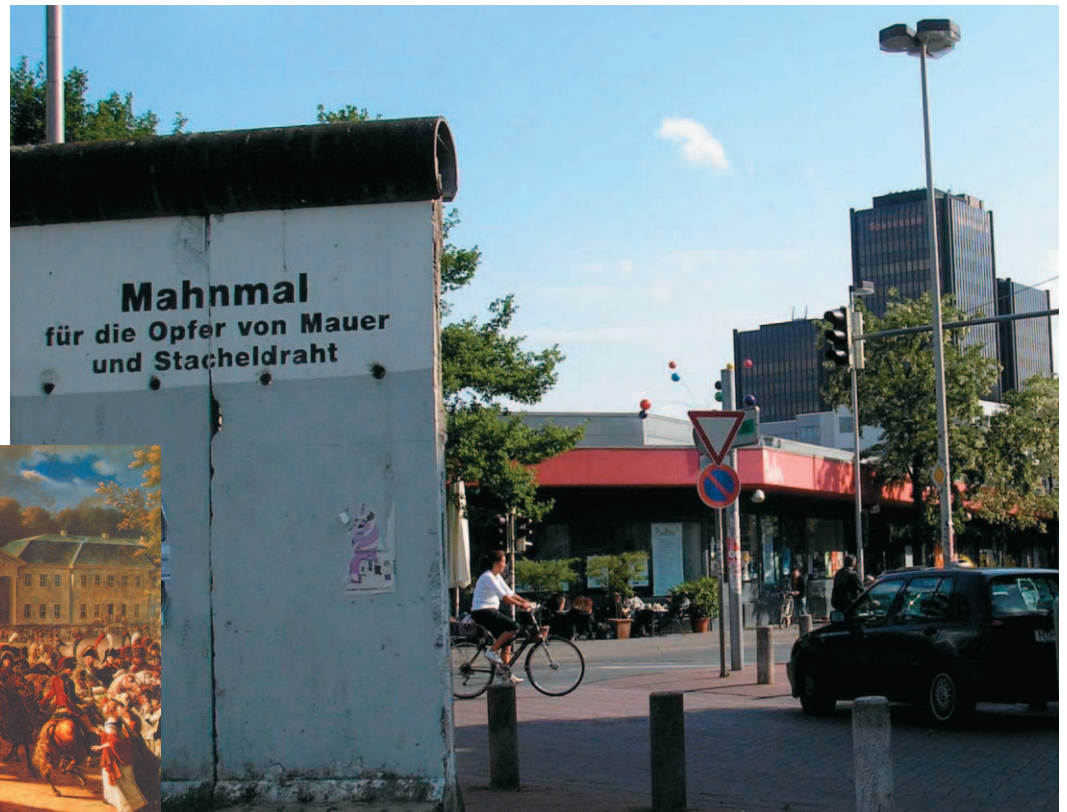
Abbildung 4 Ein Teil der Berliner Mauer steht heute als Mahnmahl und Geschichtszeichen am Weissekreuzplatz in Hannover

wir lenken sie nicht. In diesem Sinne schreibt ein großer Antipode Hegels: »Die Kräfte im Spiel der Geschichte gehorchen weder einer Bestimmung noch einer Mechanik, sondern dem Zufall des Kampfes.« 9 Damit ist nicht gesagt, dass in diesem Spiel der Kräfte jederzeit alles gleich wahrscheinlich ist. Der menschengemachte Lauf der Dinge setzt durchaus Zeichen von bleibender Kraft; der Fall der Mauer kann nicht rückgängig gemacht werden. »Weder geschichtsphilosophische Systeme, noch das Lob der Kontingenz – wenn das die Ausgangslage ist, dann bedarf es eines kritischen Umgangs mit ›Geschichtszeichen‹.« 10